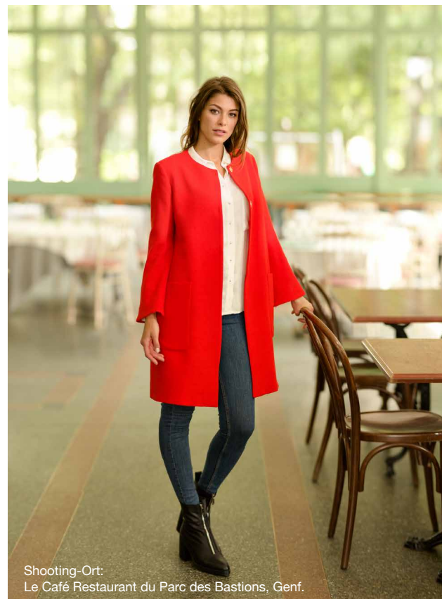
Shooting-Ort: Le Café Restaurant du Parc des Bastions, Genf.

Ob dekorativer Zierstich oder praktischer Nutstich, Sie werden von der Präzision und Gleichmäßigkeit des Stichbildes begeistert sein. Mit der Speicherfunktion der 570α können Sie einzigartige Stich-kombinationen erstellen und Texte und Namen programmieren.